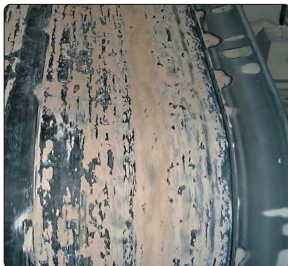
» Nastro trasportatore senza rivestimento antiaderente