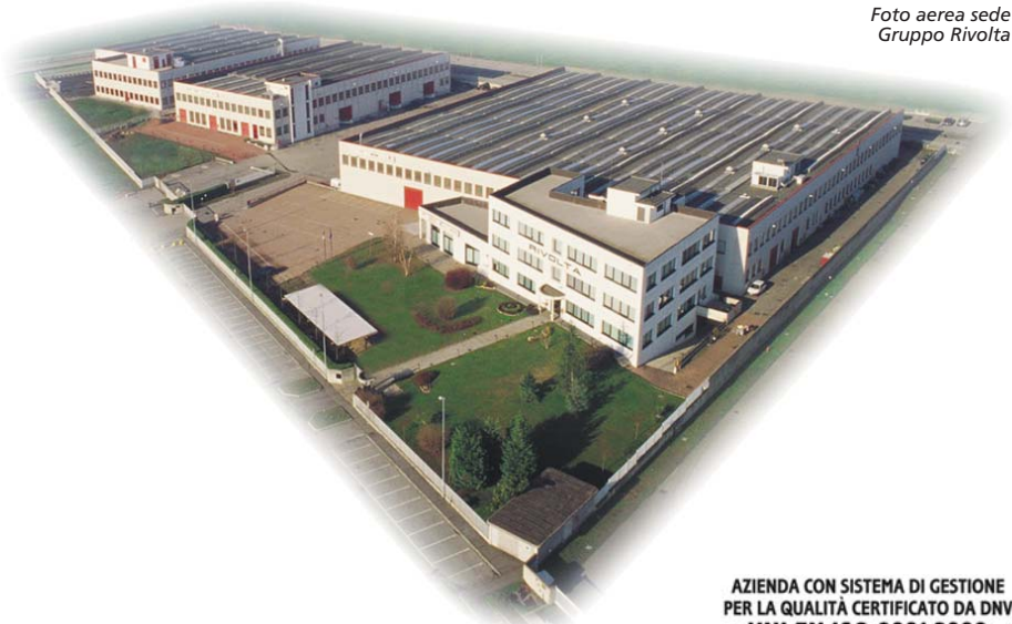
Foto aerea sede Gruppo Rivolta

SP 229 Contrada Casazze I-95040 Piano Tavola (CT) Tel. e Fax 095.71.31.637 e-mail: dcatania@rivoltagroup.com